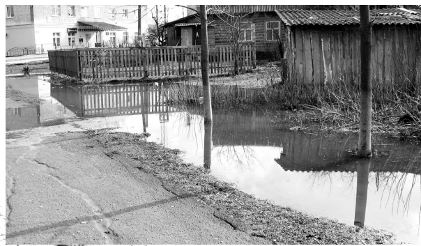
Территория возле ЧП Кузнецова.

зарос кустами, а площадь все ремонтировали, поднимали и поднимали, вода стекала к домам, и теперь мы имеем то, что имеем. И ситуация с домом №9 не изменится до тех пор, пока не придумают, как отвести от него воду. Но вот вопрос куда? Пройдите по улицам поселка и внимательно посмотрите: везде есть кюветы? Соответствуют они предъявляемым к ним