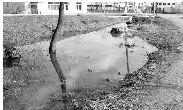
Вход в парк.