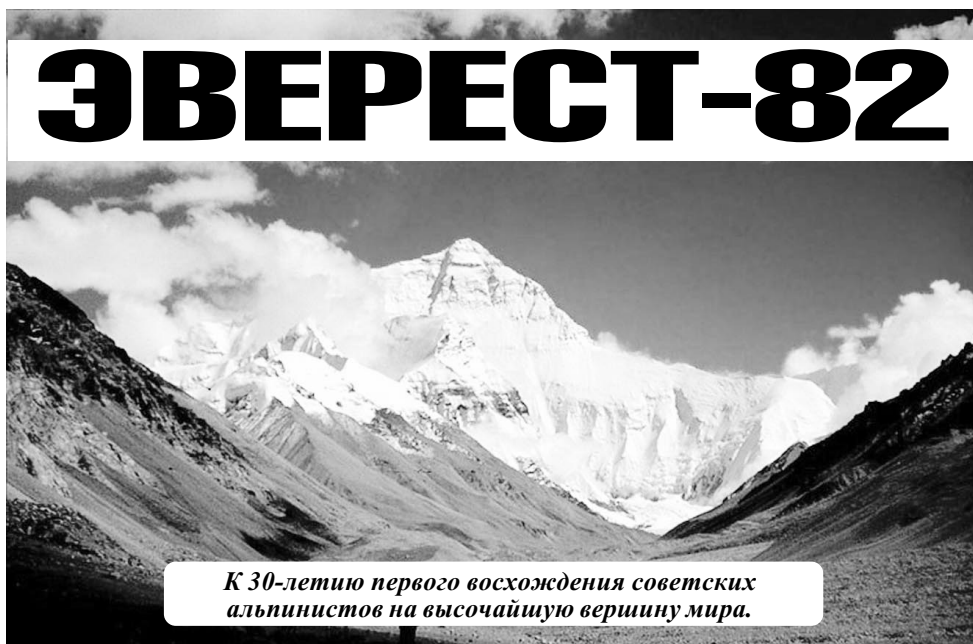
К 30-летию первого восхождения советских альпинистов на высочайшую вершину мира.

Академик О.Г.Газенко писал: «Психологический портрет альпиниста-высотника включает такие характеристики, как высокий уровень мотивации, интеллекта, склонность к абстрактному мышлению, обо-